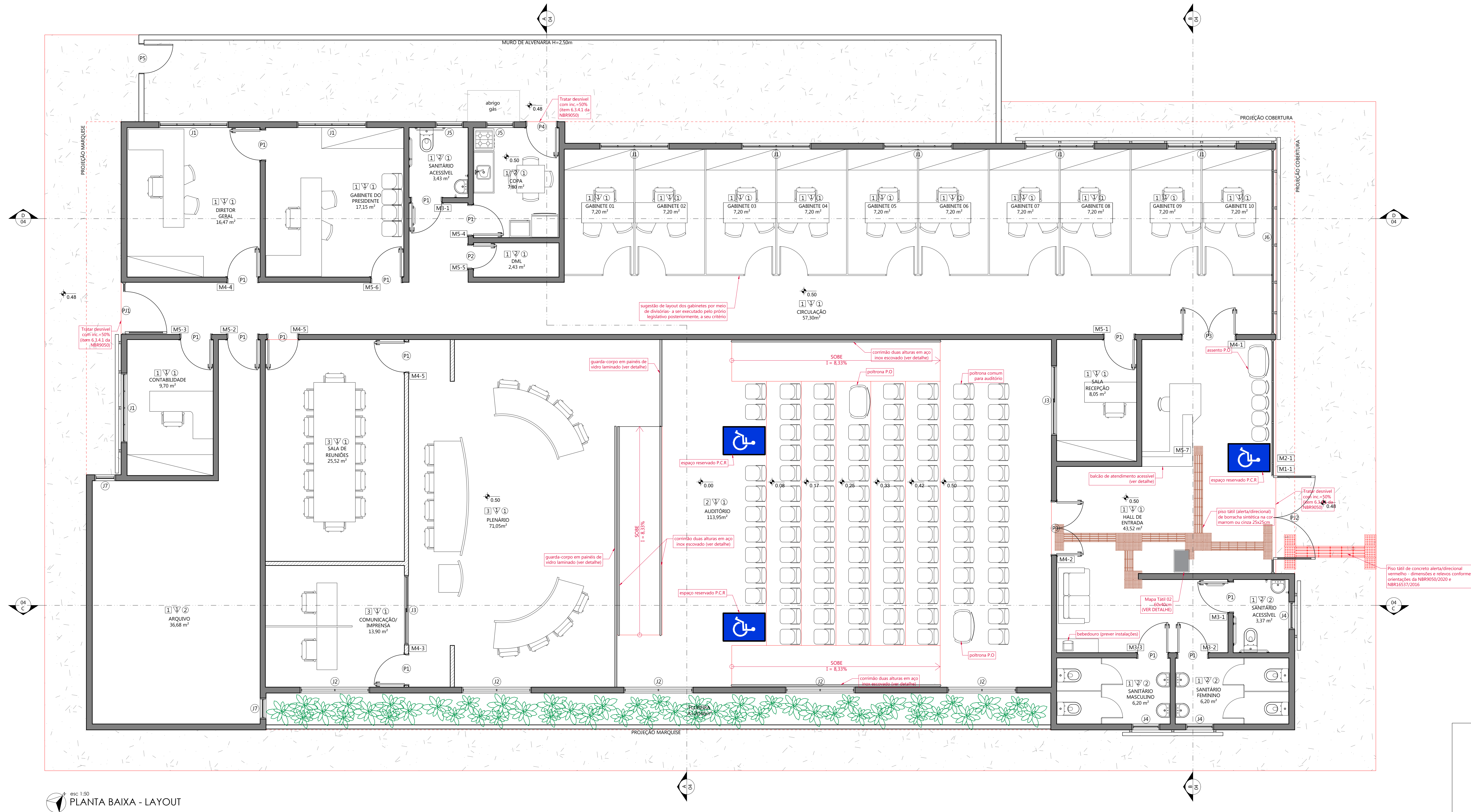
esc 1:50 PLANTA BAIXA - LAYOUT